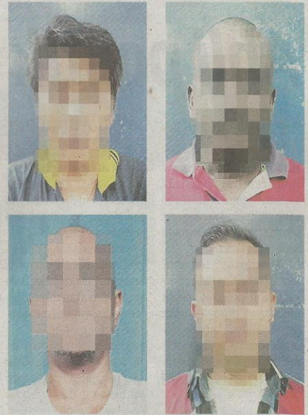
Empat suspek yang berjaya ditahan polis.

"Polis turut merampas beberapa barang suspek termasuklah sebilah parang panjang berhulu plastik warna biru dan sebilah parang