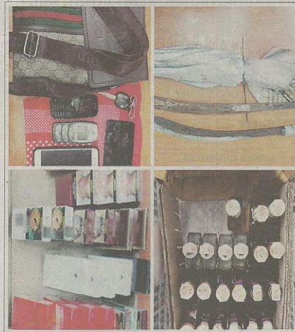
Barang yang dirampas polis dari suspek.

"Tiga suspek yang datang ke kawasan perindustrian Bukit Pelandok, dua