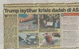
KERATAN Kosmo! 4 November 2017.

“Selain itu, NPS juga mampu memberikan kesan khayal lebih berbahaya daripada dadah tradisional dan sintetik,” katanya ketika dihubungi Kosmo! semalam.