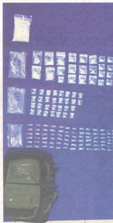
INILAH syabu seberat 10710 gram yang ditemui polis di rumah suspek di Kampung Kayan, Miri kelmarin.

Jelasnya, kes disiasat mengikut Seksyen 39B Akta Dadah Berbahaya 1952.