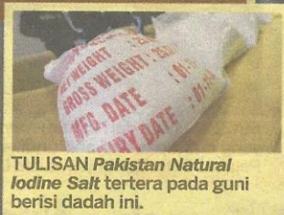
TULISAN Pakistan Natural Iodine Salt tertera pada guni berisi dadah ini.

PASUKAN Cobra JKDM mengawal kontena berisi dadah di Nilai semalam.