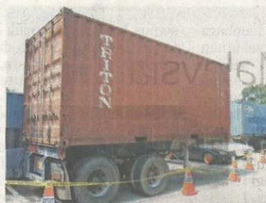
SALAH sebuah kontena berisi dadah yang diseludup masuk menerusi Pelabuhan Barat di Klang.