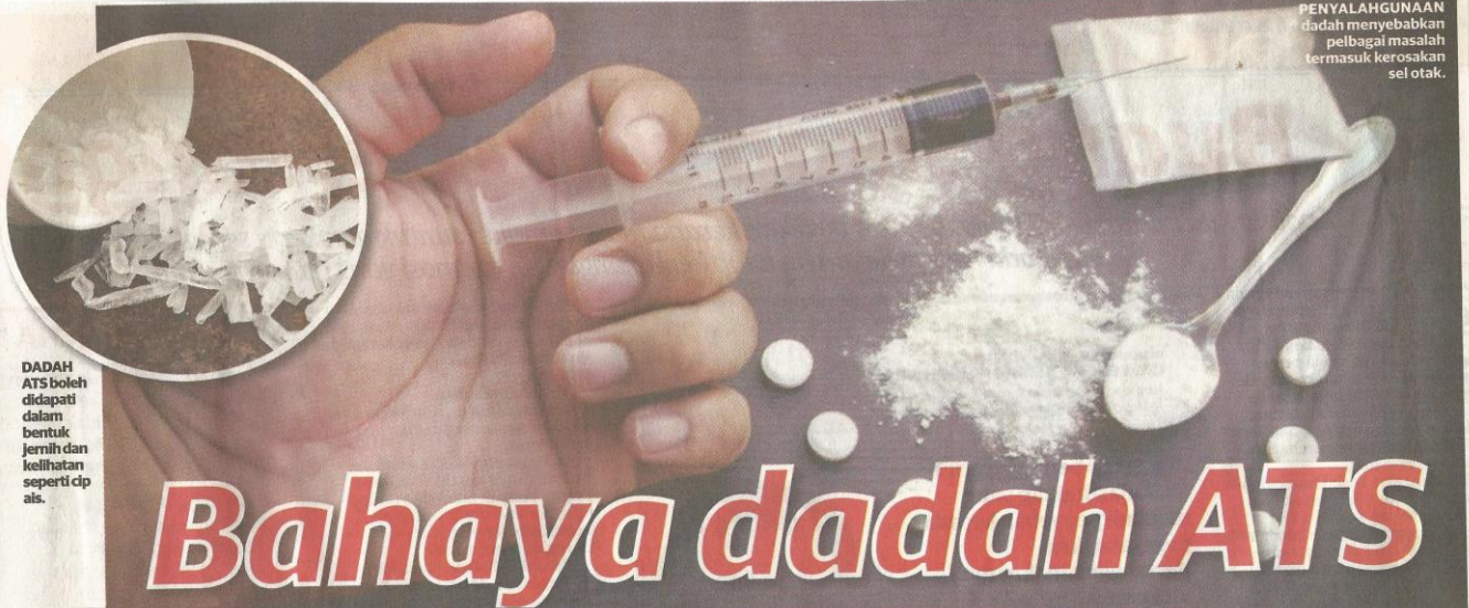
PENYALAHGUNAAN dadah menyebabkan pelbagai masalah termasuk kerosakan sel otak.