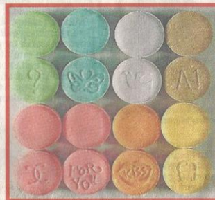
CONTOH pil ecstasy.

B EGITU banyak kisah tragis melibatkan penyalahgunaan dadah yang mengorbankan banyak nyawa. Antaranya kebakaran di Pusat Tahfiz Darul Quran Ittifaqiyah di Jalan Keramat Ujung, Kuala Lumpur yang mengorbankan lebih 20 nyawa. Semua angka beberapa kanak-kanak yang mencetuskan kebakaran dibawah pengaruh dadah jenis Amphetamine Type Stimulant atau ATS.